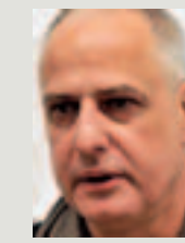
Luc Tuymans Woonst en werkt in Antwerpen. Wordt naast Jan Fabre en Wim Delvoye beschouwd als een invloedrijke hedendaagse kunstenaar.