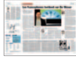
Absoluut tweetalig zijn

Béatrice Delvaux, hoofdredactrice, 13 augustus 2010