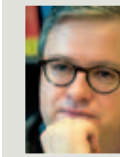
Carl Devos Politoloog, hoogleraar aan de faculteit politieke en sociale wetenschappen van de Universiteit Gent.