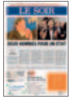
Brussel is niet te koop

BÉATRICE DELVAUX, HOOFDREDACTRICE, 5 NOVEMBER 2007