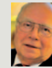
Mark Eyskens Minister van Staat, doctor in de rechten van de KU Leuven. Woont in Heverlee en heeft meer dan 40 boeken geschreven.