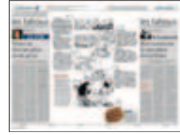
We zullen de Brusselse rand wat moeten lossen

Béatrice Delvaux, hoofdredactrice, 23 september 2010