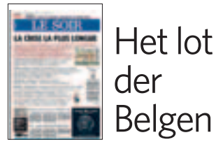
Het lot der Belgen

KORT GEZEGD « Le Soir » is de Franstalige krant die het hardst investeert in berichtgeving over Vlaanderen. Lees hier hoe ze dat doet.