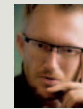
David Van Reybrouck Cultuurhistoricus, archeoloog en schrijver. Is om de vijf weken kroniekschrijver voor de rubriek « Vlaamse Stoemp ».